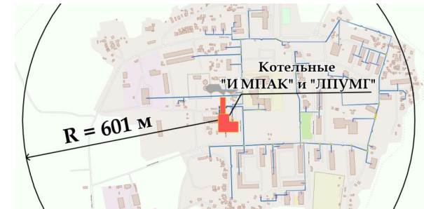
Рисунок 3 – Радиус эффективного теплоснабжения котельных Сорумского ЛПУ МГ и Импак