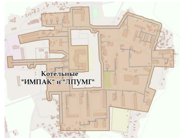
Рисунок 2 – Зона действия источников тепловой энергии

Раздел 2. Существующие и перспективные балансы тепловой мощности источников тепловой энергии и тепловой нагрузки потребителей